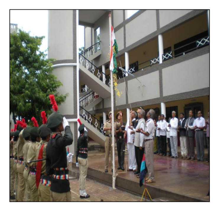
Independence Day was organised on 15/08/2018