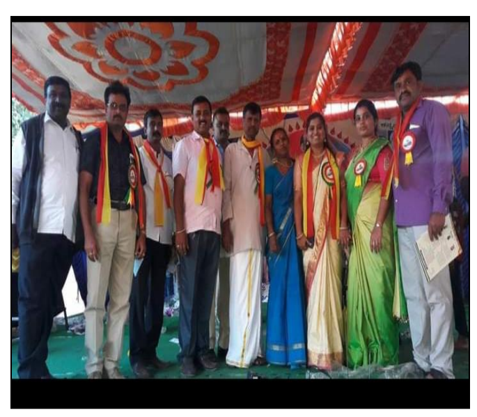
Gandhi Jayanthi was organised on 02/10/2019